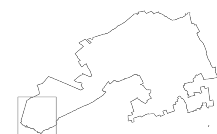
Quadro di unione degli elementi su base areofotogrammetrica comunale in scala 1:100.000