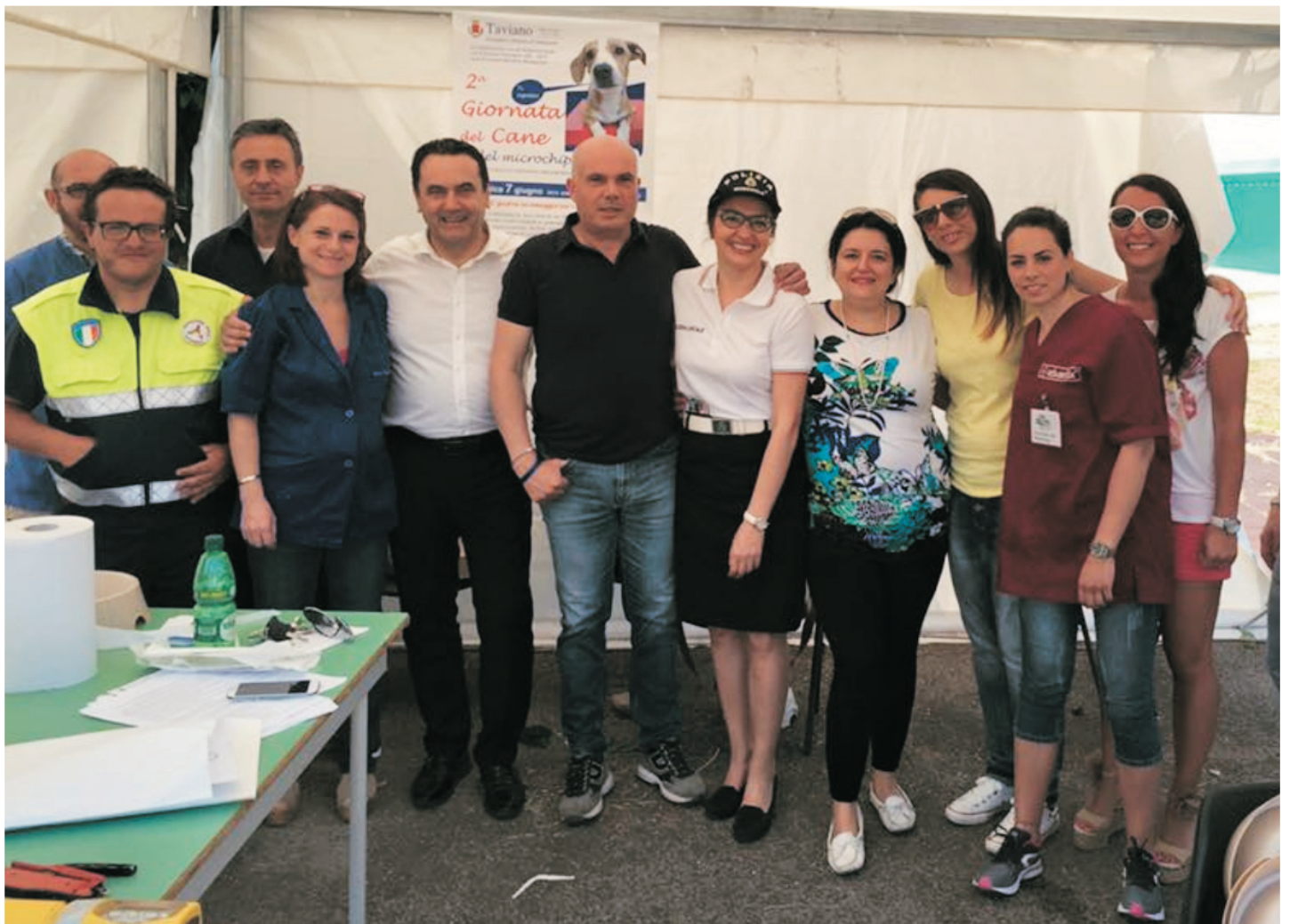
8 Giugno, "Giornata del Cane" alla presenza del Sindaco, degli Amministratori, dei Medici Veterinari, dei Volontari, del Comando Polizia Municipale e della Protezione Civile.

Nel giugno scorso l'Amministrazione Comunale ha organizzato un'altra "giornata del cane" per sensibilizzare la cittadinanza verso la cultura del rispetto degli animali d'affezione, l'obbligatorietà dell'iscrizione all'anagrafe canina, l'applicazione del microchip ai cani di proprietà, la prevenzione del randagismo, organizzata in collaborazione con il dipartimento di prevenzione della ASL di Lecce - servizio veterinario, con il Comando della Polizia Municipale, con i volontari animalisti locali e con i medici veterinari aderenti. Si è registrata un'inversione di tendenza rispetto alle politiche precedenti, che vedevano i cani randagi una volta reclusi in canile restarci fino alla morte. L'Amministrazione Comunale del Sindaco Portaccio ha, invece, dirottato l'attenzione sulla politica dell'adozione, per la quale i cani rimangono collocati solo temporaneamente in canile, fino al momento dell'adozione, che è avvenuta nella maggior parte dei casi attraverso le staffette agite dai Volontari, in sinergia con Protezione Civile e Polizia Municipale. I Volontari, inoltre, anche in seguito alle adozioni, effettuano delle verifiche circa il buon esito delle stesse.